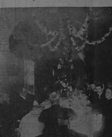
Aspecto del comedor durante el banquete.